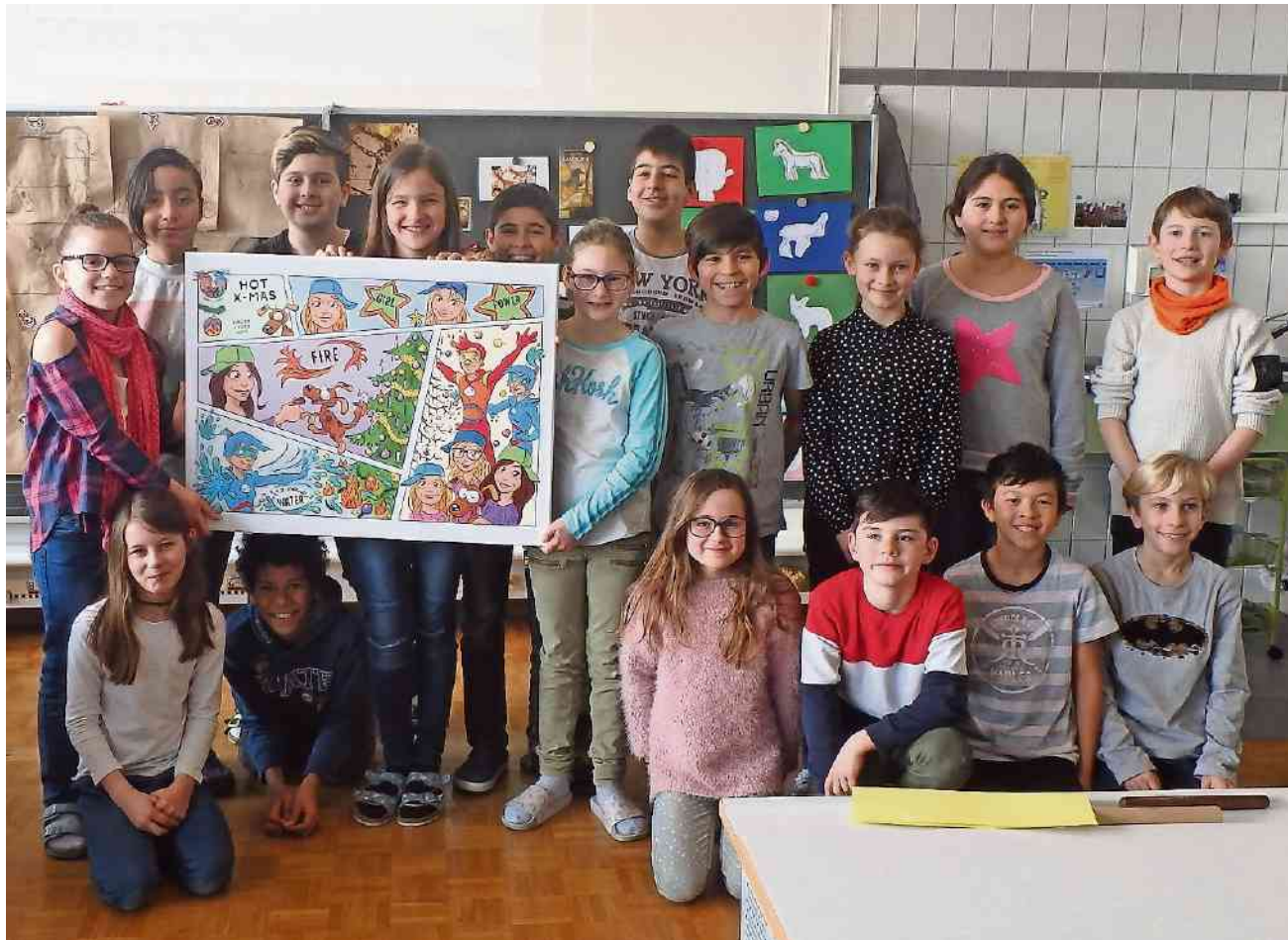
Die Viertklässler erhalten den professionell gezeichneten Comic in Form eines Leinwanddrucks.